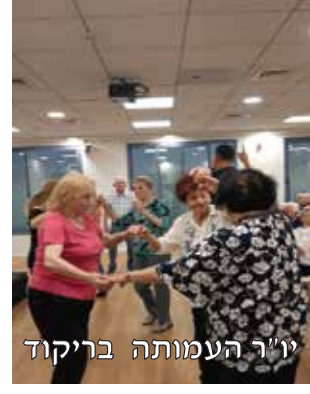
יו"ר העמותה בריקוד