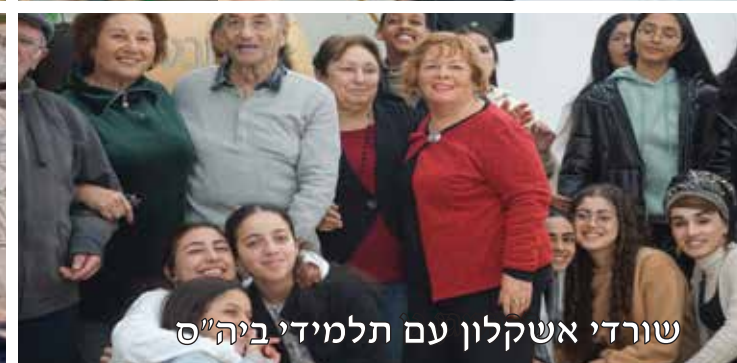
שורדי אשקלון עם תלמידי ביה"ס