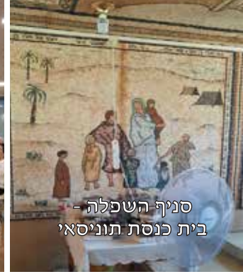
סניף השפלה - בית כנסת תוניסאי