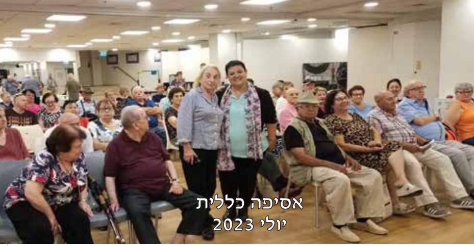
אסיפה כללית יולי 2023