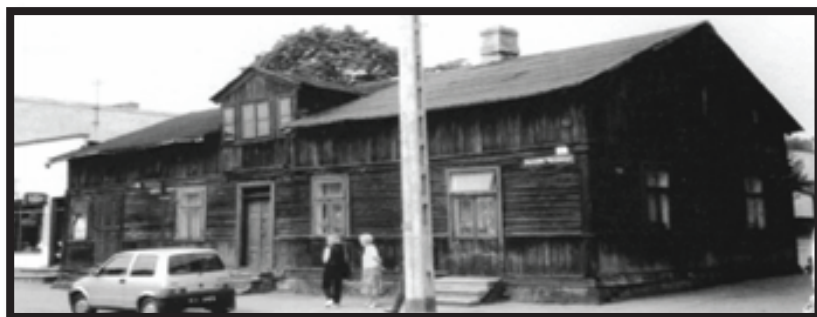
הבית בו גדלתי בויז'בניק-סטרחוביצה

לא מצוינים ביומן תאריכים והסיבות מובנות. הם לא היו ידועים לי, וגם לא היתה להם שום משמעות לגבי. הזמן באותם ימים נתפס באופן שונה גם ע"י מבוגרים. לפני כעשר שנים, תרגמתי את זכרונותיי לעברית, למען ילדיי. אחת הסיבות לכך, שהיא הזמן להכיר באותו עבר כאוב שלי, לתת לו לגיטימציה ולא להתכחש לו יותר. בהיותי כבת שש, אני