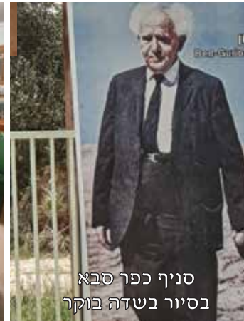
סניף כפר סבא בסיום בשדה בוקר