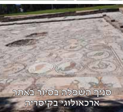
סניף השפלה בסיור באתר ארכאולוגי בקיסריה