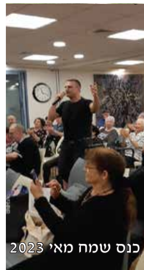
כנס שמח מאי 2023