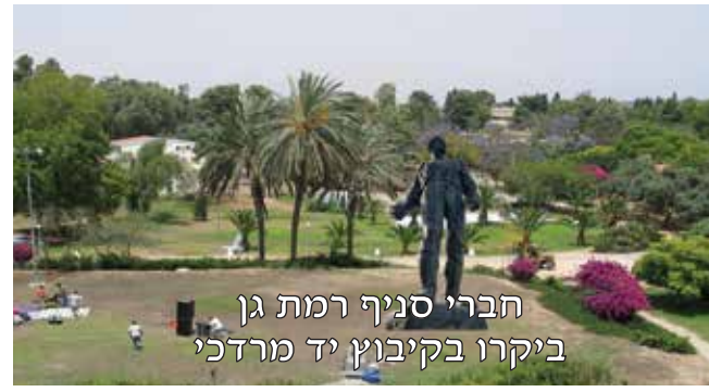
חברי סניף רמת גן ביקרו בקיבוץ יד מרדכי