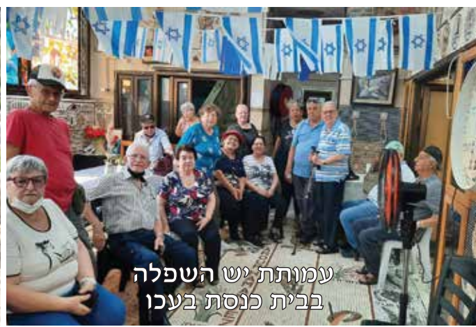
עמותת יש השפלה בבית כנסת בעכו