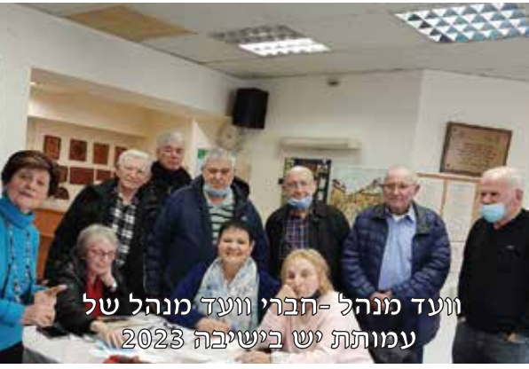
וועד מנהל - חברי וועד מנהל של עמותת יש בישיבה 2023