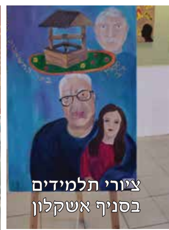
ציורי תלמידים בסניף אשקלון