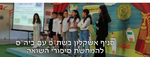
סניף אשקלון בשת"פ עם ביה"ס להמחשת סיפורי השואה