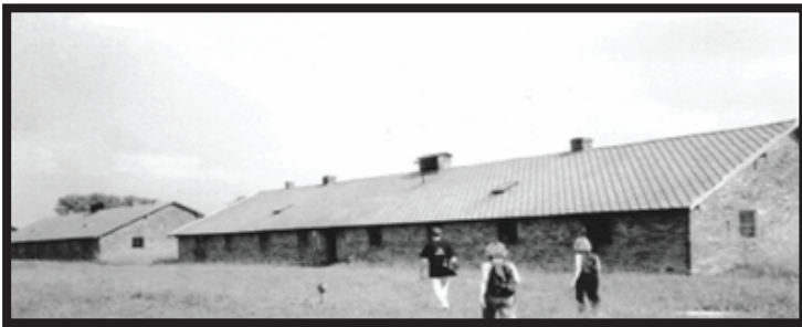
בלוק 25 באושוויץ (ביקור עם המשפחה ב-1998)