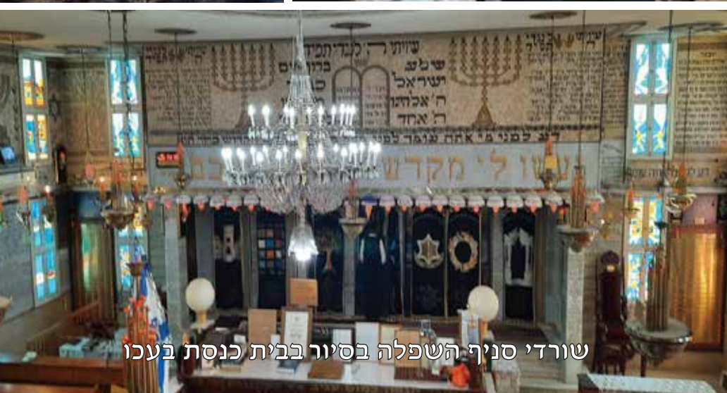
שורדי סניף השפלה בסיור בבית כנסת בעכו