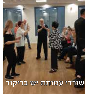
שורדי עמותת יש בריקוד