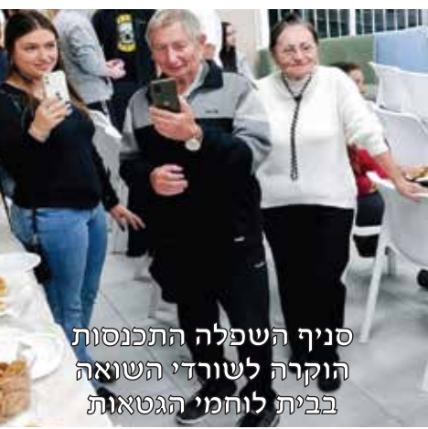
סניף השפלה התכנסות הוקרה לשורדי השואה בבית לוחמי הגטאות