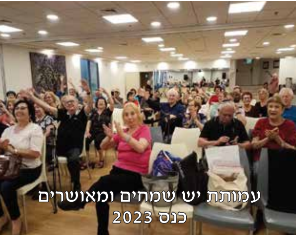
עמותת יש שמחים ומאושרים כנס 2023