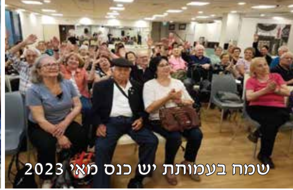
שמח בעמותת יש כנס מאי 2023