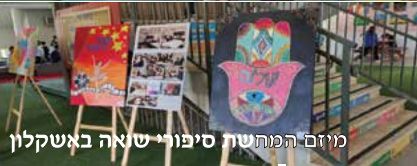
מיזם המחשת סיפורי שואה באשקלון