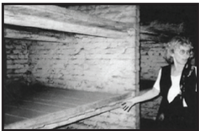
הדרגש באושוויץ, ששכבו עליו, אמא, אני ועוד אם וביתה

הייתי ישנה יחד איתה, ובחמש לפנות בוקר רצתי מהר לבלוק הילדים, שם היו סופרים אותנו כל בוקר.