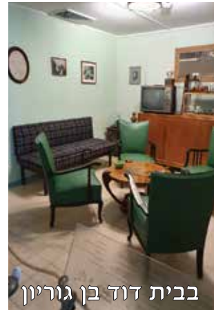
בבית דוד בן גוריון