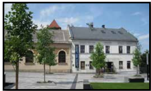
הבית שנתרם והפך למוזיאון

זמן קצר לאחר מכן נשלחו כל היהודים למחנה אושוויץ, שהוקם בסמוך לעיירה אושווינצ'ים, והומתו בתאי הגזים, ביניהם האם מרים והילדים מינה ויעקב.