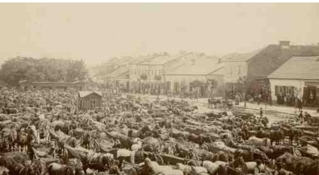
ה'רינק' - כיכר העיר אופטוב