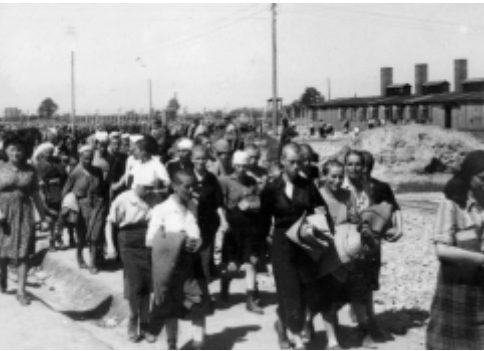
האסירות מובלות לבלוק לאחר הבדיקה