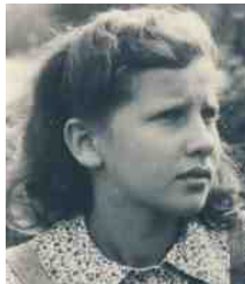
אני בברגן בלזן, 1945