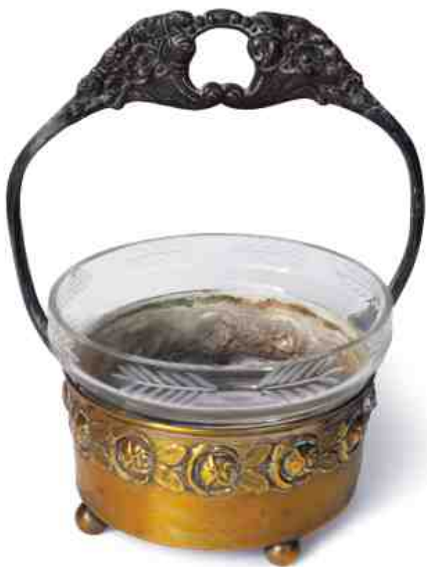
קערת סוכריות, השריד היחיד מבית הורי