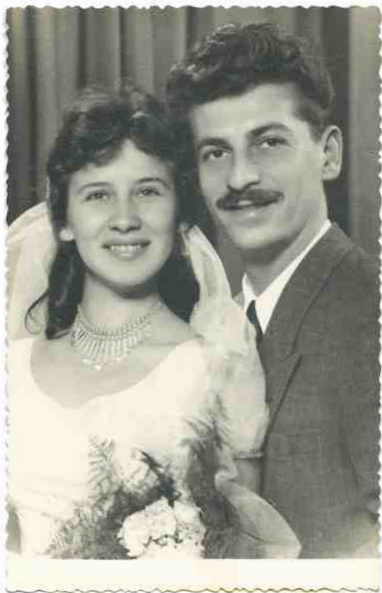
חתן וכלה, 17.11.1953