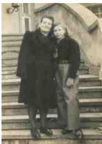
אמא ואני, ברגן בלזן, 1946