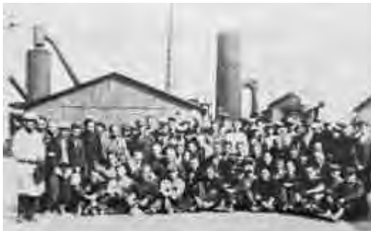
קבוצת עובדים בחזית כור ההיתוך בסטרחוביצה