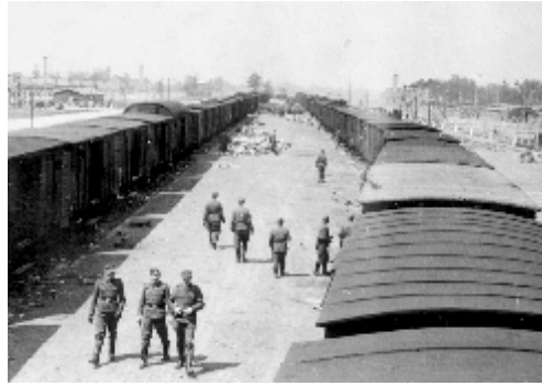
הגעת הרכבות לאושוויץ