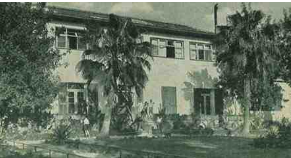
בית הכיתות בכפר הנוער בן-שמן