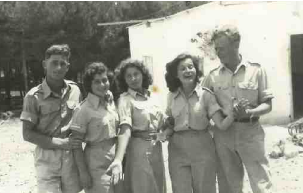
במחנה הגדנ"ע, מגרש המחנות שעל הכרמל, אני במרכז.