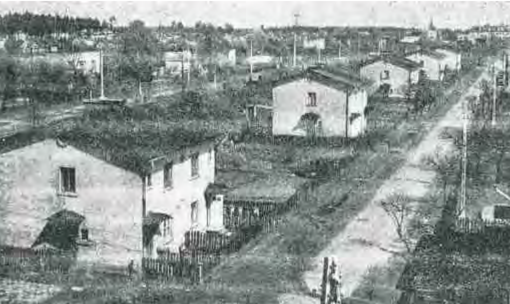
שכונת עובדי מפעלי הנשק והתחמושת הפולנים בסטרחוביצה בה התגוררה משפחת דנישבסקי