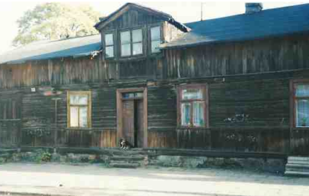
בית משפחתי ברחוב פילסוצקיגו 40, ווייז'בניק