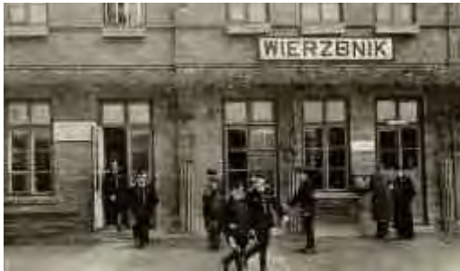
קציני צבא גרמנים בווייז'בניק