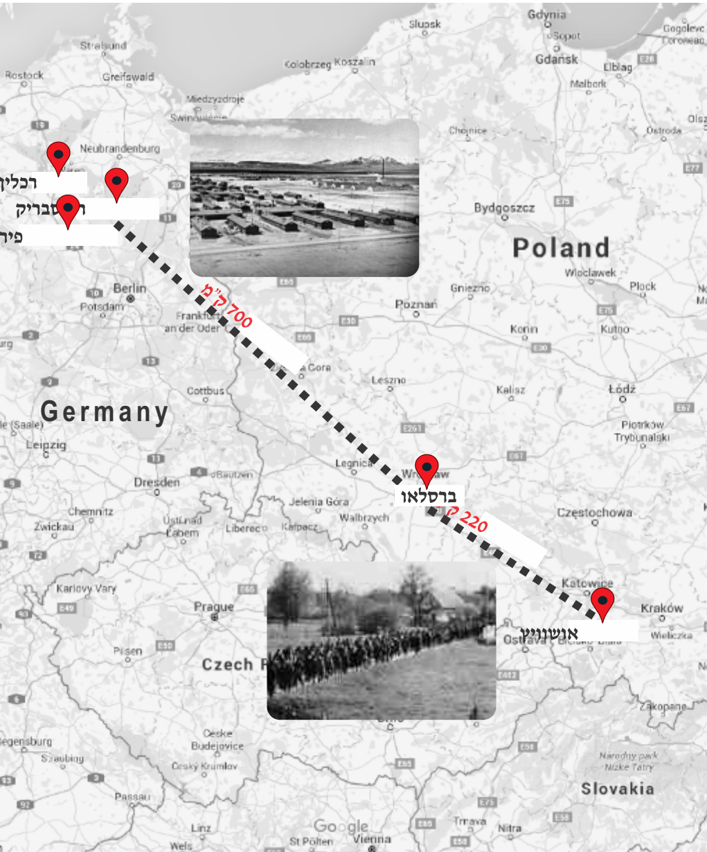
צעדת המוות מאושוויץ לרבנסבריק