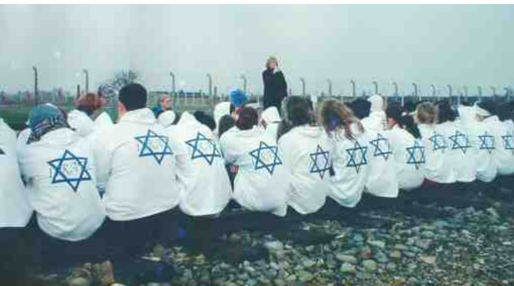
עם תלמידי ביה"ס התיכון "הר-וגיא" שבגליל העליון, באושוויץ-ברקנאו