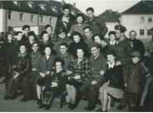
מורי בית הספר בברגן בלזן, 1946