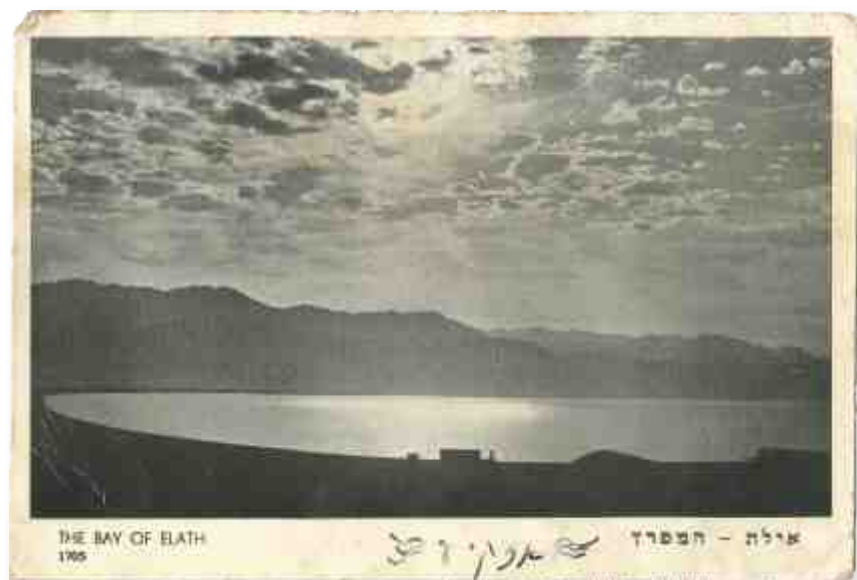
מפרץ אילת, 1951. בחוף - צללית צריף השק"מ.