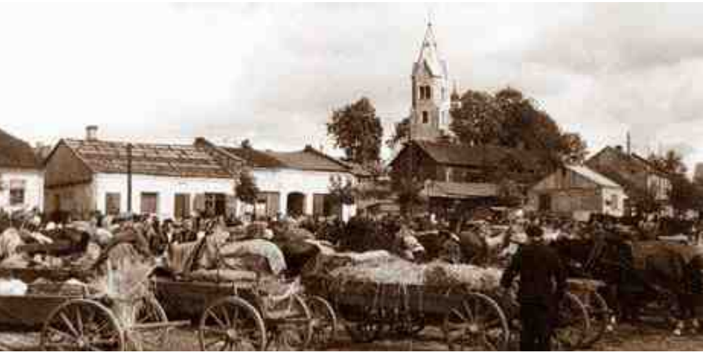
ה'רינק' של ווייז'בניק