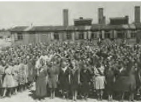
האסירות עומדות לספירה לפני הבלוק