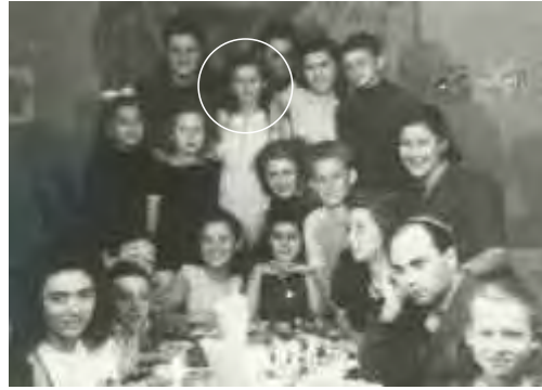
חגיגת יום הולדת 12, ברגן בלזן 1945