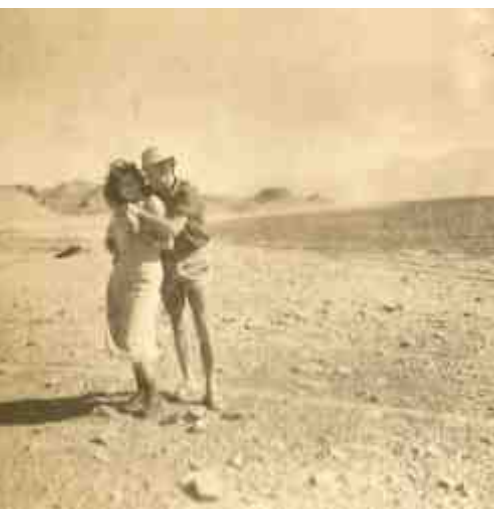
עם מנחמק'ה בחוף אילת, 1951