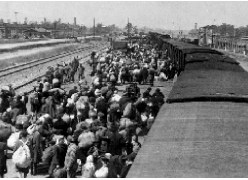
ירידת נוסעי הרכבות לרציף באושוויץ