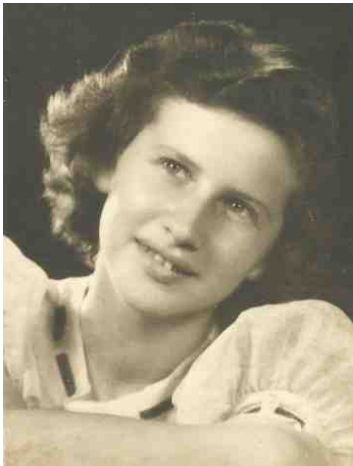
אני בת 17, חיפה, 1950