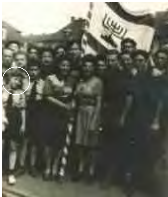
הפגנה נגד ה'ספר הלבן', 1946