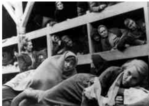
השינה על הדרגשים בצריפי הנשים