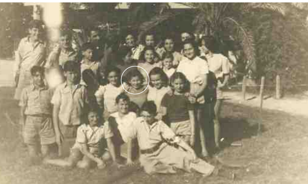
קבוצה ג', כפר הנוער בן-שמן, 1947