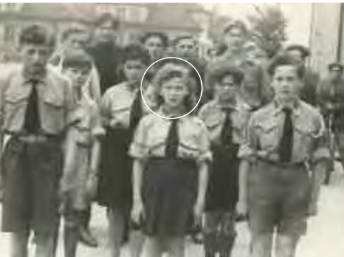
בתנועת בית"ר, מימיני לולק הג'ינג'י