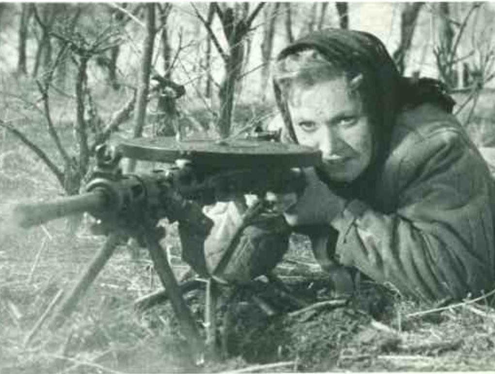
גיבורת הסרט "היא מגנה על המולדת" (Ona broni ojczyzne), 1943