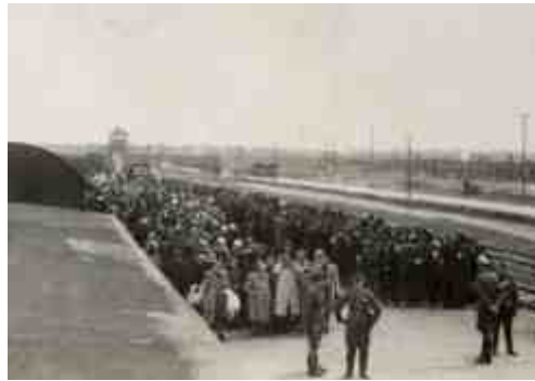
ההפרדה בין הגברים לנשים ולילדים