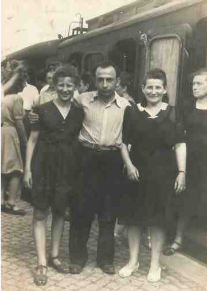
אמי (מימין) ואני בדרך למרסיי ברכבת, 1947