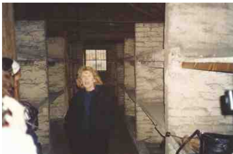
בלוק 25, מחנה הנשים A-Lager בבירקנאו - אני מראה לתלמידים את הדרגש עליו ישנתי עם אמי.