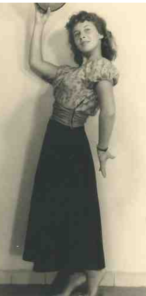
'דיבוק' הריקוד בגיל 17