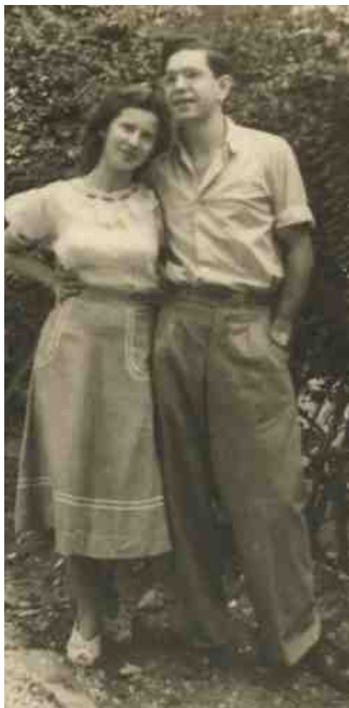
עם אמיתי, 1950