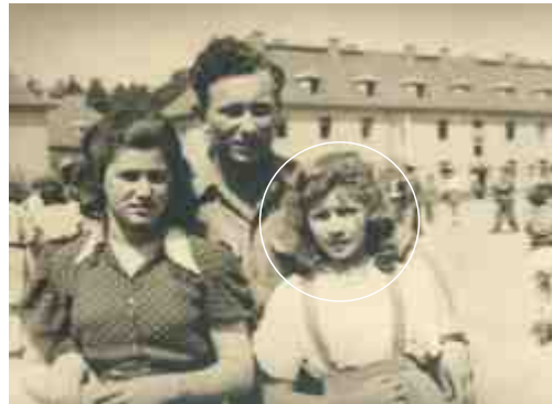
עם הלינה וחיייל מהבריגדה היהודית