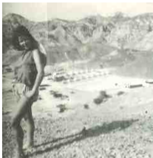
מעל חוות הגדנ"ע באר אורה, 1951