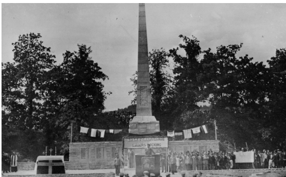
טקס האזכרה שנערך ליד מצבת הזיכרון לקרבנות מחנה פוקינג, צולם ב - 22 ביוני 1947. מחנה פוקינג היה מחנה בת של מחנה פלוסנבורג Flossenbuerg