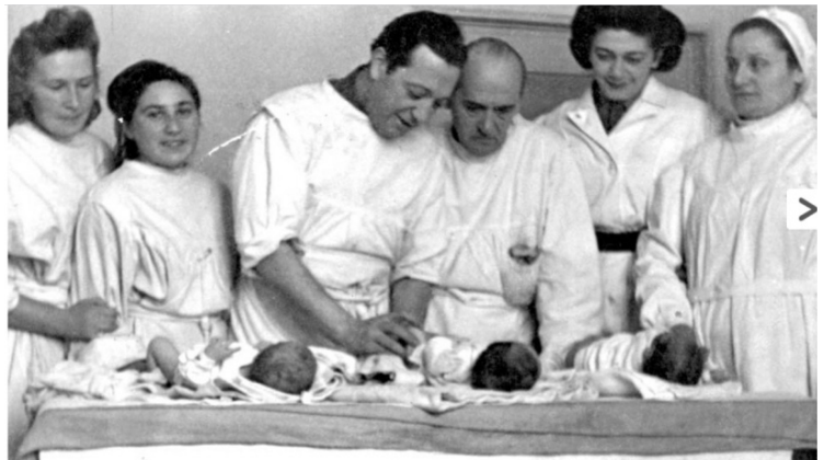
תינוקות עם צוות בית חולים במחנה העקורים פוקינג, 1947 ארכיון התלמים של יד ושם, 1486/855