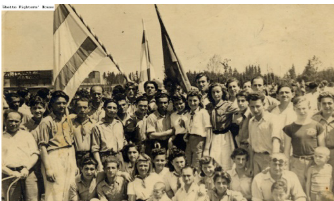
חגיגות ה- 1 במאי 1947 בסניף תנועת דרור במחנה העקורים פוקינג

מחנה העקורים רחש פעילות פוליטית מכל הזרמים הקיימים. בצילום משמאל: הוועידה הארצית הראשונה של תנועת "פועלי ציון - צ"ס" בגרמניה. הצירים שרים את שירו של ביאליק "תחזקנה". הוועידה נערכה מהארבעה ועד לשישה ביולי 1947 במחנה העקורים פוקינג. לשון הכרזה (ביידיש) שמעל לשולחן הנשיאות של הוועידה הארצית הראשונה של תנועת "פועלי ציון - צ"ס" בגרמניה: "אנו מברכים את הנציגים והאורחים לכנס הארצי הראשון של פועלי ציון - צ"ס"