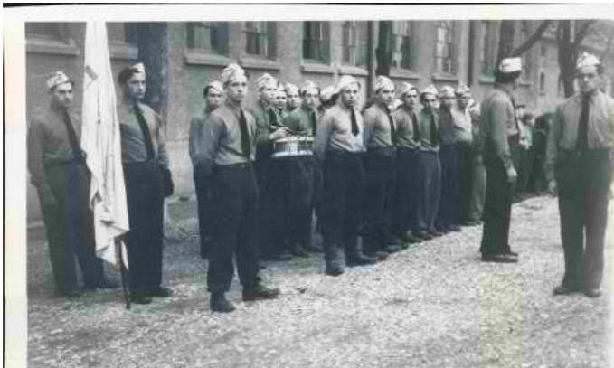
מפקד של חניכי תנועת בית"ר במחנה העקורים פוקינג