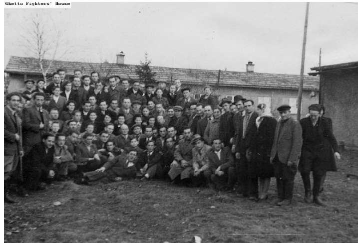
יוצאי העיירה מלאבה במחנה העקורים פוקינג, מרץ 47

1. משוחררים אך לא חופשיים – זהו הפרדוקס היהודי. אברהם קלאוזנר, רב הצבאי בצבא ארה"ב, דכא, יוני 1945 "המבול חלף, הסערה שככה. ספינתנו מוטלת הרוסה. נישאנו על גלים גועשים וניצלנו – קומץ של אנשים מהספינה שנטרפה. נפלטנו מהים הרוגש, ועתה יושבים אנו בהרי בוואריה, שבורים, גלמודים, מיותמים. אך כבר מתחילות רוחות השלום לנשב. קמעה קמעה, אנו מתאוששים ומתחילים לתפוס מה קשה המכה שהיכו בנו. בחוסר סבלנות אנו מחכים ליונה שתביא לנו זלזל ירוק מהחופים הבהירים שם נקווה למצוא מעט נחמה. חמישה חודשים חלפו מאז שוחררנו, רעבים, שדופי רזון, אבודים, הרוסים ממחלות שונות יצאנו ממחנות הריכוז בגרמניה, להחלים מהמחלות ולהשיב את הכוחות הפיזיים לקצטניקים הדואבים – זו הייתה משימתנו הראשונה"