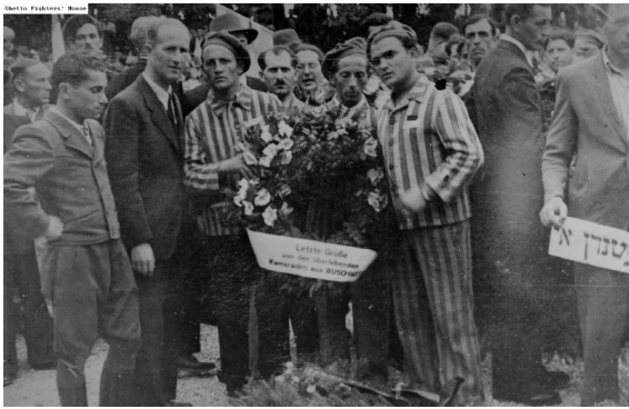
אסירים לשעבר ממחנה פוקינג שבאו לטקס זיכרון ב - 22 ביוני 1947. שלושה מהמצולמים לובשים בגדי אסירים.

מלבד שרידי מחנה העקורים נכחו בטקס גם החיילים האמריקנים משחררי המחנה ונציג מקומי. לאחר שנסגר מחנה העקורים, הוצע לרב מייזלס להתמנות לרב בשיקגו, אך הוא סירב להישאר בגולה, ובשנת 1949 עלה עם משפחתו לישראל.