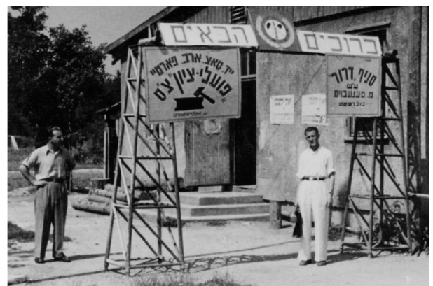
תנועת דרור, הקיבוץ ע"ש חיים ארולוזרוב