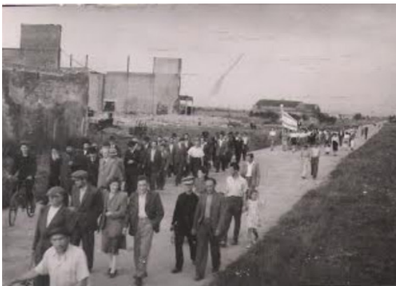
מחנה העקורים פוקינג

התעורר צורך למצוא פיתרון להמוני הפליטים היהודים שברחו לשטחי השליטה האמריקאית. למרבה האבסורד, רבים מהם נאספו במקומות ריכוז גדולים – בהם היו מחנות הריכוז הנאצים בתקופת המלחמה. אמריקאים לא ידעו איך לנהוג עם הפליטים היהודים והחלו לבחון פתרונות. ארל הריסון, שליח מיוחד של טרומן כתב בדו"ח מיוחד לנשיאו: