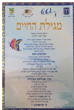
מגילת החיים נמסרת לנותני העדות בתום המפגשים המשותפים