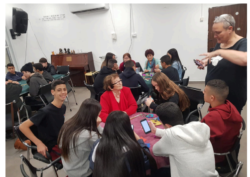
מעגלי שיח משותפים לנותני עדות וקבוצת בני נוער בחולון.