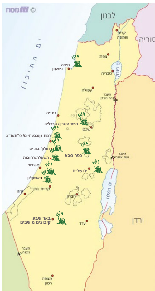
סניפי עמותת יש ברחבי הארץ